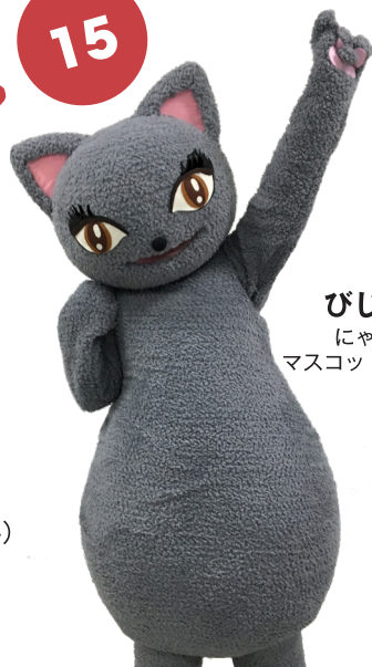
びじゅたん にゃんだらけ マスコットキャラクター