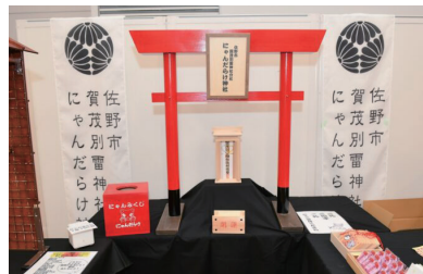
佐野市賀茂別雷神社分社にゃんだらけ神社