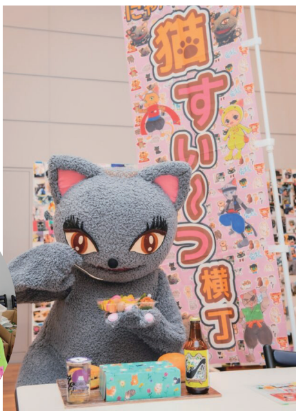
にゃんカフェ&猫すい〜つ横丁